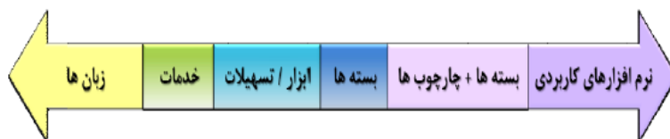
شکل شماره (۲)

و در سمت چپ طیف، زبان مدیریت فرآیندهای کسب و کار مانند BPEL یا جاوا، و در سمت راست طیف، یک سیستم کامل مدیریت فرآیندهای کسب و کار قرار دارد که می تواند نوع خاصی از فرآیند را پشتیبانی کند.